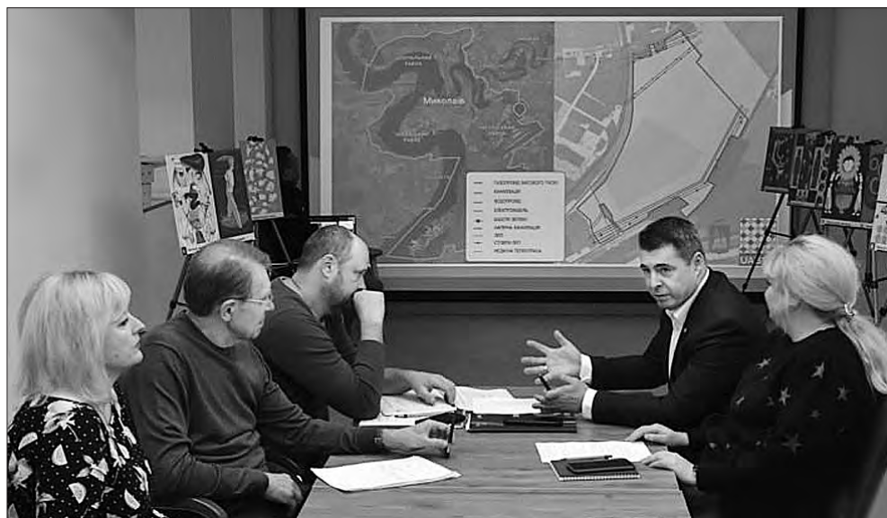
На першому засіданні експерти розглянули можливість реалізації ідеї індустріального парку для Миколаєва.

«У сучасному світі індустріальні парки стають каталізаторами для приваблення інвестицій, створення нових робочих місць, сприяння технологічному прогресу та впровадження інновацій-