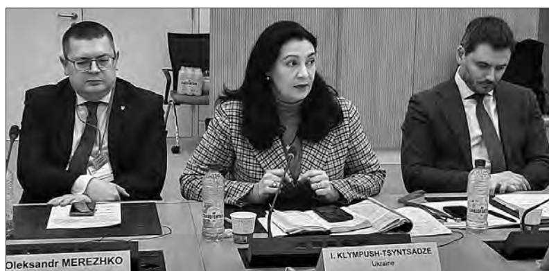
Олександр Мережко, Іванна Климпуш-Цинцадзе, Єгор Чернев.

Прес-служба Апарату Верховної Ради України.