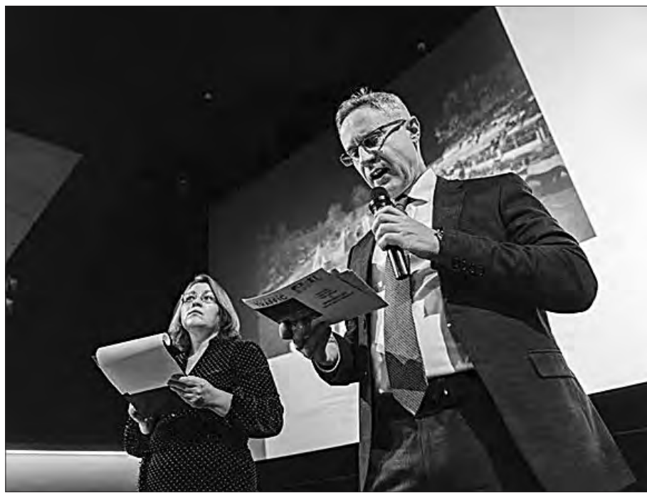
Під час церемонії нагородження.

Т. в. о. міністра культури та інформаційної політики України Рос-